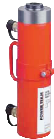
30, 60, 100 Ton Double-Acting Models Feature Threaded Collar