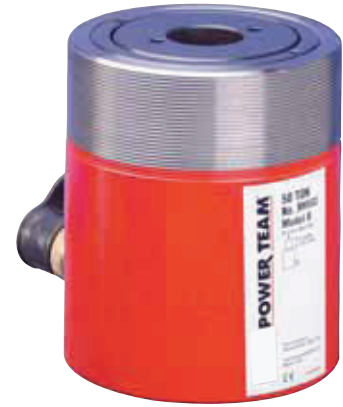
ASME B30.1 700 bar

* Model RH203 and RHA306 do not feature the collar thread. See the chart below.