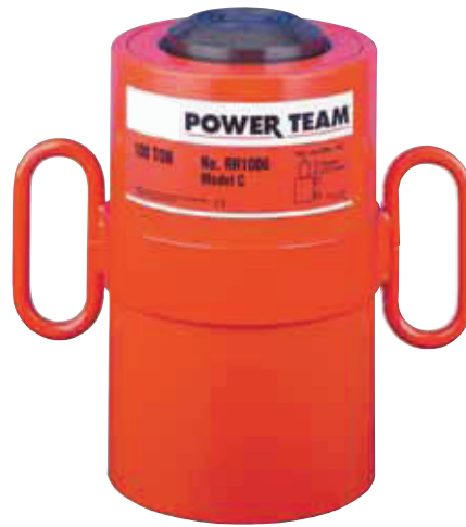
30, 60, 100, 150, 200 Ton Double-Acting Models Feature Plain Collar